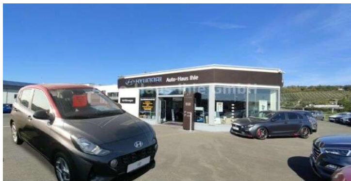
Auto-Haus Ihle GmbH